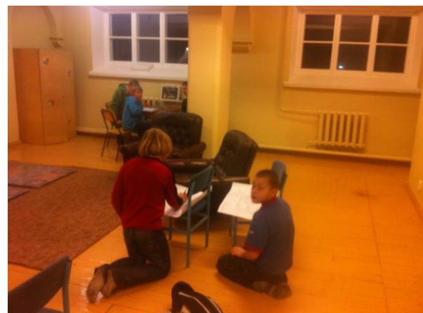
Noored linna tajukaarte joonistamas.