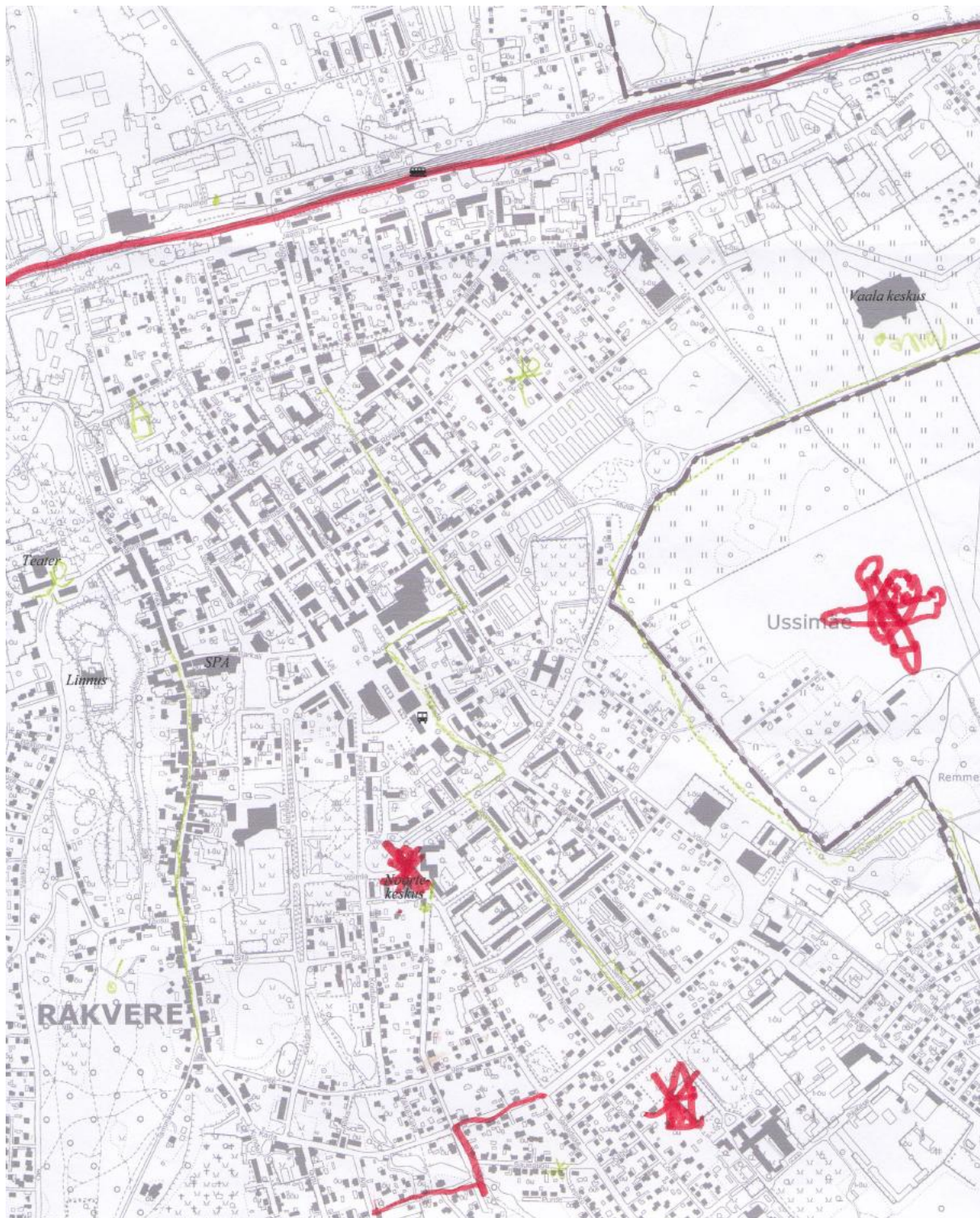
Skem 2.2 Näited joonistatud tajukaartidest