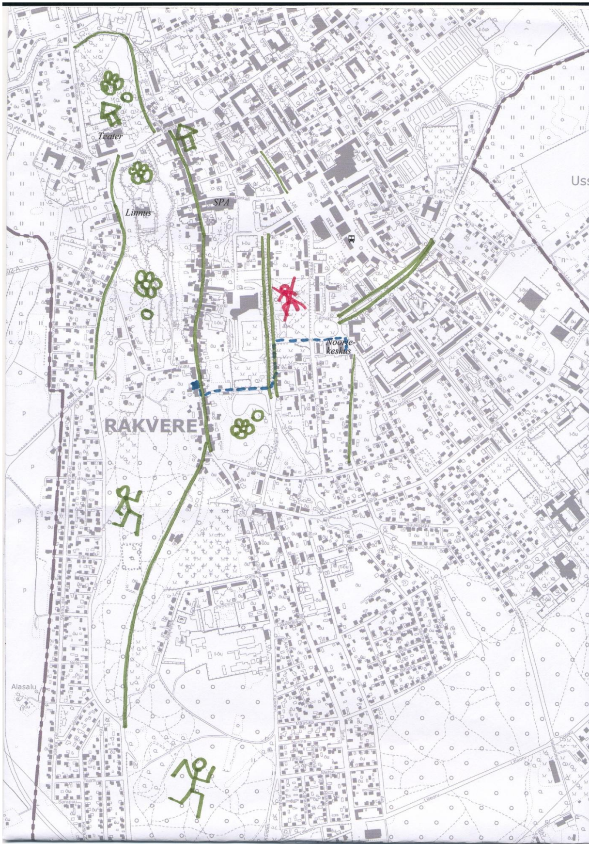
Kaasav planeerimine Rakvere linnas Projekti „Koos arenev Rakvere“ raames koostatud soovituslik juhendmaterjal